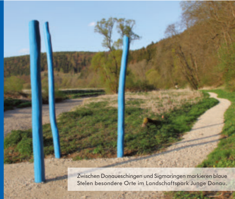
Zwischen Donaueschingen und Sigmaringen markieren blaue Stelen besondere Orte im Landschaftspark Junge Donau.

Der zweitlängste Strom Europas, die 2.840 km lange Donau, ist dann spurlos im Sand und Geröll verschwunden. Nach maximal 60 Stunden hat das Wasser ein riesiges Höhlen- und Spaltensystem durchlaufen und dadurch auch die europäische Wasserscheide verschoben bzw. überwunden. Im etwa 180 m tiefergelegenen Aachtopf, der größten Quelle Deutschlands, tritt es dann wieder aus. Die Schüttung der Quelle kann bis zu 24.000 Liter pro Sekunde betragen.